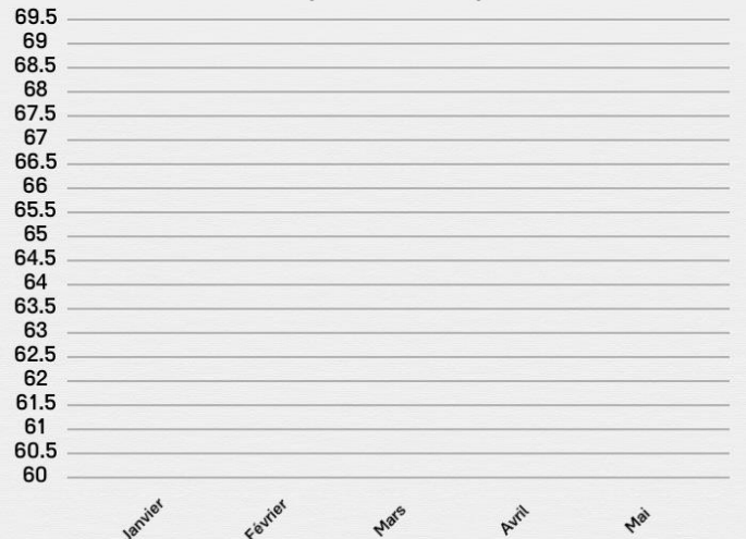
Prix du plein d'essence par mois