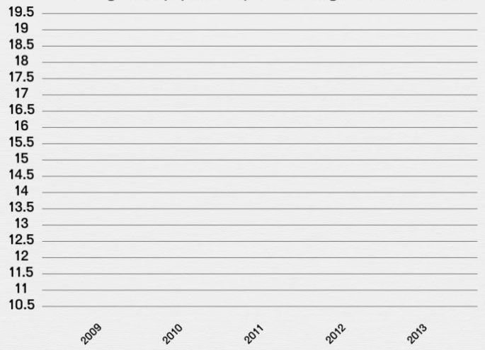
Pourcentage de la population qui a déménagé au cours de l'année