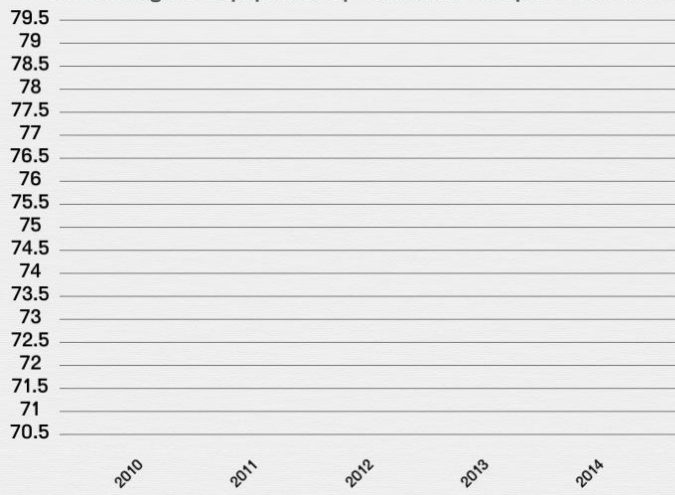
Pourcentage de la population qui utilise les transports en commun